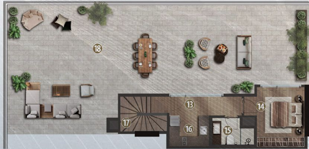
Dubleks Üst Kat / Duplex Upper Floor

Not: Plan boyaması örnek tip olup, brüt alana daire tipine göre ortak alan payı / tahsisli teras alanları / tahsisli bahçe alanları / eklenti teras alanları / eklenti depo alanları eklenecektir. Note: Common area ratio / allotted terrace areas / allotted garden areas / additional usage terrace areas / additional usage storage areas will be added to Unit Gross Areas of each different unit type. Color plan above is a sample plan and optional unit plans are available.