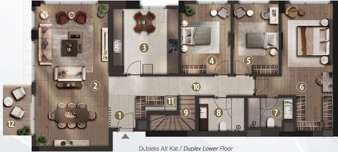
Dubleks Alt Kat / Duplex Lower Floor