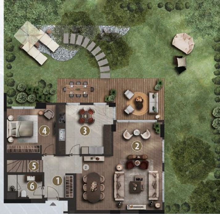
Dubleks Alt Kat / Duplex Lower Floor