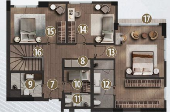
Dubleks Üst Kat / Duplex Upper Floor

Not: Plan boyaması örnek tip olup, brüt alana daire tipine göre ortak alan payı / tahsisli teras alanları / tahsisli bahçe alanları / eklenti teras alanları / eklenti depo alanları eklenecektir. Note: Common area ratio / allocated terrace areas / allocated garden areas / additional terrace areas / additional storage areas will be added to Unit Gross Areas of each different unit type. Color plan above is a sample plan and optional unit plans are available.